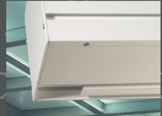
Abbildungen: ProfiIntegral in RAL-Ausführung